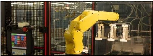
IoT industrial / automação de fábrica e robótica