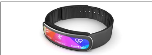
Wearables (smart watches, monitores de saúde, RA e RV)