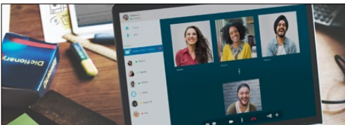
Módulos de comunicação de telecomunicações/rede 5G (roteadores Wi-Fi e dispositivos de malha)