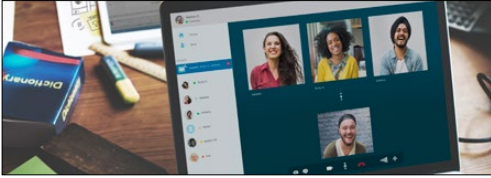
5G ağlar/telekomünikasyon iletişim modülleri (WiFi yönlendiriciler ve mesh cihazlar)