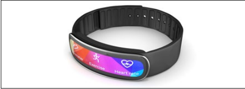
Giyilebilir cihazlar (akıllı saatler, sağlık monitörleri, AR ve VR)